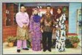
Penulis bergambar bersama Pengarah dan Pustakawan Perbadanan Perpustakaan Awam Negeri Perak

Bagi mengotengahkan satu perseorangan sebuah buku yang memperhalus penguasaan gaya bahasa yang menyegarkan di samping mengahangi peristiwa penah