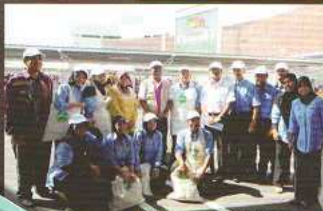
Mengerusi bersejajar bersama WVP pada hari perkhidmatan penanaman pokok.