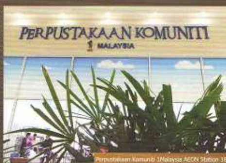
Perpustakaan Komuniti Malaysia AEON Station 18

Inisiatifnya, perpustakaan ini dibuka pada jam 10.00 pagi hingga 10.00 malam setiap hari sepanjang tahun. Sejak dibuka sambutan amat menggalakkan dan membanggakan.