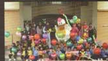
Sesi berbilang bahasa di Maktab Dak