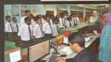
Penerangan di Kantor Sektoral Utama