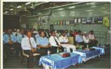
Peserta lawatan sedang mendengar taklimat yang disampaikan