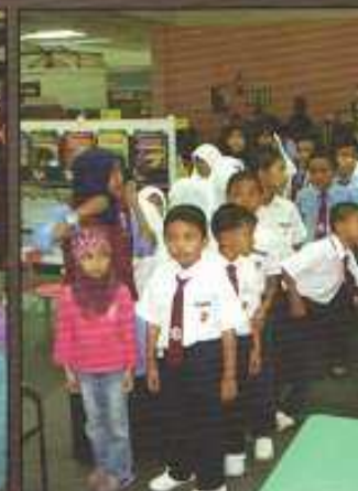
Lawatan ke Perpustakaan Kandi Anak