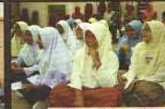
Aktiviti yang memperhalus perniagaan lawatan