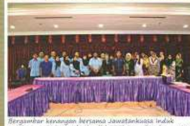
Bergambar kenangan bersama Jawatankuasa induk amalan persekitaran berkaualiti SS Dewan Bandaraya Ipoh

LAWATAN KE KD MANJANG UTARA Selain itu, Jawatankuasa induk telah di jemput oleh Malaya Productivity Corporation (MPC) Wilayah Utara ke lawatan amalan persekitaran berkaualiti SS ke KD Makawangsah berpangkalan di TUDET Lumut yang merupakan kapal perang TUDET tertua yang pertama menerima pengiktirafan sijil amalan persekitaran berkaualiti SS. Kali ini hanya Jawatankuasa induk bersama Tuan Pengarah PPANPK telah membuat lawatan tersebut pada 19 Mac 2012.