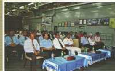
Peserta lawatan sedang menuliskan taklimat yang disampaikan.