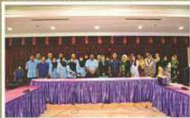
Bergambar kenangan bersama Jawatankuasa Induk amalan persekitaran berkualiti SS Dewan Bandaraya Ipoh

LAWATAN KE KD MANAWANGSA (19/03/2012) Selain itu, Jawatankuasa Induk telah di jemput oleh Malaysia Productivity Corporation (MPC) Wilayah Utara ke lawatan amalan persekitaran berkualiti SS ke KD Manawangsa berpangkalan di TUDM Lumut yang merupakan kapal perang TUDM tertua yang pertama menerima pengiktirafan sijil amalan persekitaran berkualiti SS. Kali ini hanya Jawatankuasa Induk bersama Tuan Pengarah PFANPK telah membuat lawatan tersebut pada 19 Mac 2012.