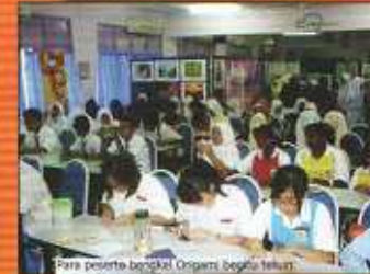
Para peserta bergalil Origami beggu teluk mempamerkan seni lukisan

Acara ini bermula di atas selangannya dari semua pihak dalam menyokong pengagungan program kali ini dan tabung kepada semua peminat.