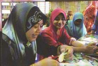
Sebahagian peserta kraftangan felt