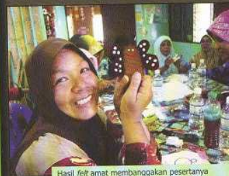
Hasil felt amat membanggakan pesertanya