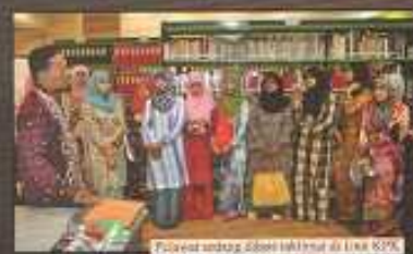
Tawak undang-undang berkaitan di Lina KPR

Sehingga Jun 2012, Perpustakaan Awam Negeri telah menerima 9 kunjungan lawatan sambil belajar daripada pelbagai institusi dan jabatan. Pelbagai aktiviti telah diadakan bagi menyokong dan memajukan semua peringkat umur kunjungan mereka ke perpustakaan, meningkatkan sentiasa makna dan konsep yang boleh dibawa oleh anak-anak sekolah dan penuntut kolej. Bagi pelajar daripada kalangan pra-sekolah, tawak dan tahap 1, pelbagai program pataktikan telah dijalankan untuk memberikan keceriaan kepada mereka sepanjang program lawatan. Malah bagi pelajar daripada agensi berkaitan pula diberi taktimat perenggan dan jawa-jawa perkhidmatan yang ditawarkan.